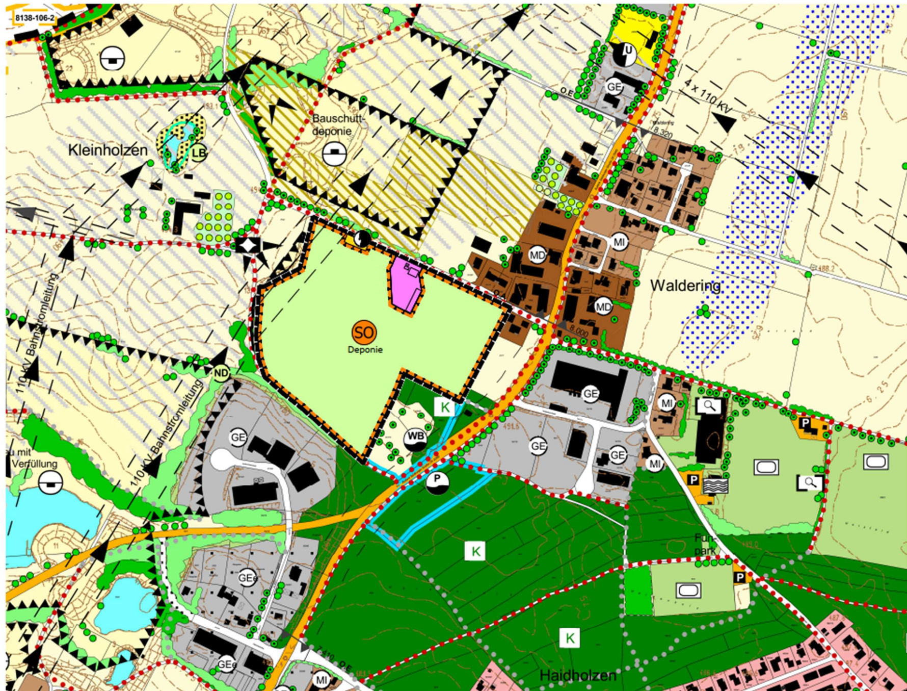
27. ÄNDERUNG DES FLÄCHENNUTZUNGSPLANES IM BEREICH DEPONIE WALDERING