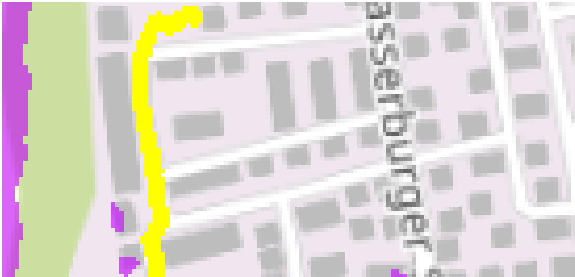
Abb. 3: Ausschnitt Umwelt-Atlas mit Karteninhalt „Oberflächenabfluss und Sturzflut“ Darstellung „mäßiger Abflussbereich“ (gelb) und potentieller Aufstaubereich (lila) im Planungsumgriff (blau) – ohne Maßstab

Im voralpinen Bereich können Starkregenereignisse (Gewitter, Hagel etc.) besonders heftig auftreten und werden durch die Klimaänderung an Häufigkeit und Intensität weiter zunehmen. Dabei können Straßen und Privatgrundstücke flächig überflutet werden. Auch im Planungsgebiet kann dies nicht ausgeschlossen werden.