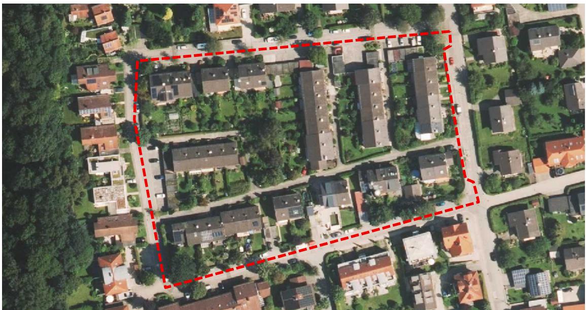
Abbildung 1: Lage des Änderungsbereiches – rot - ohne Maßstab

Der Änderungsumgriff befindet sich im Ortsteil Schlossberg ca. 200 m nordöstlich des Ortszentrums. Der Geltungsbereich umfasst die Flurstücke Nr. 2853/23 - /67, /70 - /109 sowie Teilfläche der Flurstücke 2853/68 (Baumerstraße) und 2695 (Wasserburger Straße). Die Fläche befindet sich in der Gemarkung Stephanskirchen. Der Änderungsumgriff hat eine Größe von ca. 15.053 m 2 .