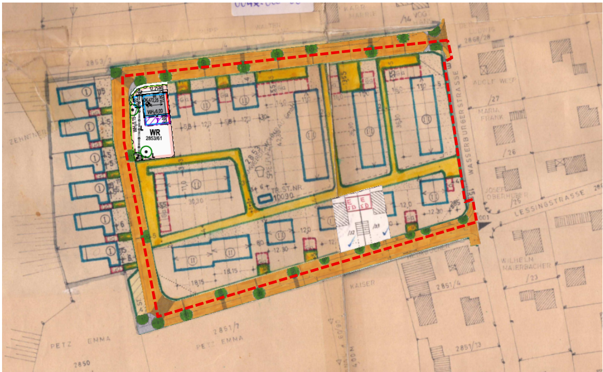
Abbildung 3: Ausschnitt Ur-Bebauungsplan Nr. 4 mit Darstellung Änderungsbereich - rot - ohne Maßstab

Darüber hinaus sind unter anderem Festsetzungen zur Höhenentwicklung, Einfriedung und Dachgestaltung getroffen.